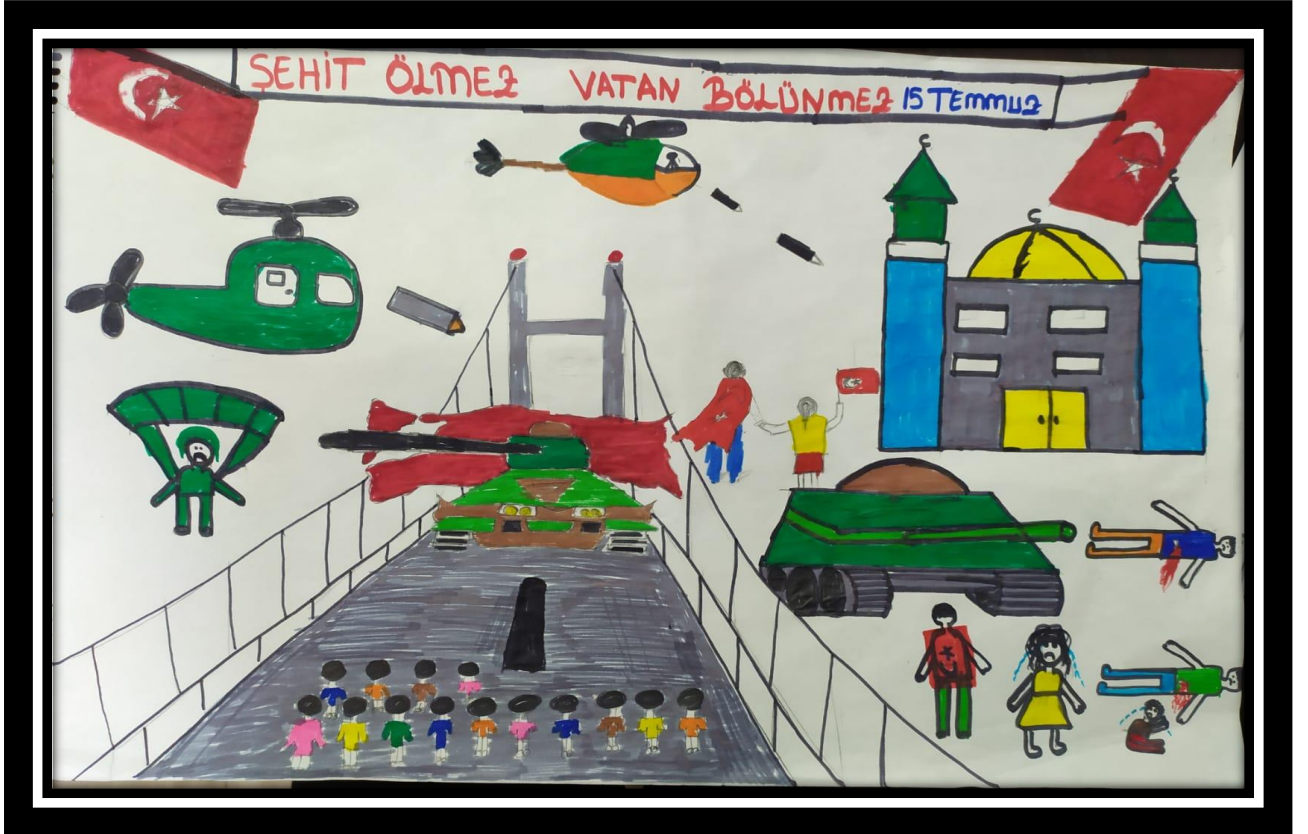
Muhammed Emin YAKUT 7/C Sınıfı Öğrencisi